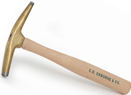
Martillo tapicero 280mm.