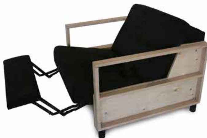
Mecanismo en sillón tapizado. Manual. Posición relax.