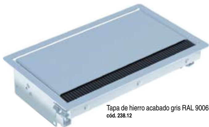
Tapa de hierro acabado gris RAL 9006 cód. 238.12