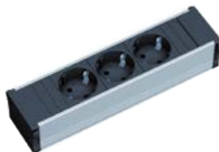
Módulo de 3 enchufes cód. 238.9