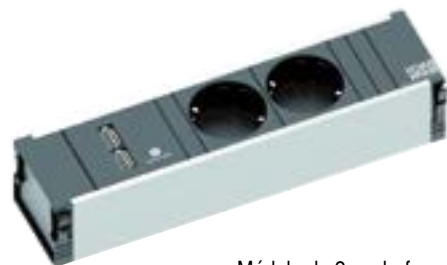
Módulo de 2 enchufes + 2 USB cód. 238.10