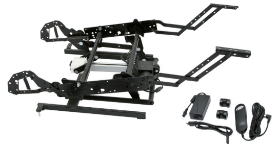
Mecanismo con 1 motor

Posición de elevación para incorporarse fácilmente.