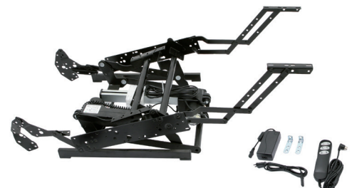
Mecanismo con 2 motores

Posición de elevación para incorporarse fácilmente.