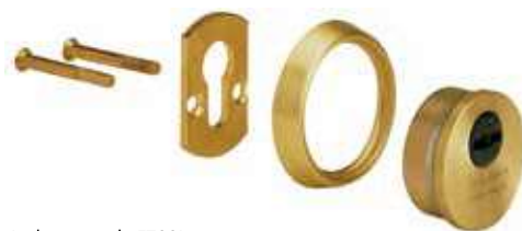
Incluye escudo E700L