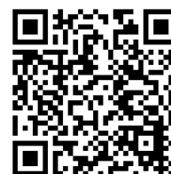
ARINO / ARINOM