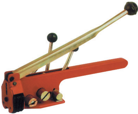
Flejadora manual Manual strapping machine