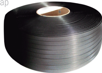
Fleje de plástico Plastic strap